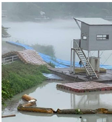
6月14日 ゴール付近状況