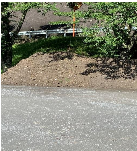
第1配艇場 除去した大量の土砂

6月14日（水）は厚く湿った土砂が溜まった状態だったが少し乾いた状態で重機を入れ土砂を除去し隅に山積み保管