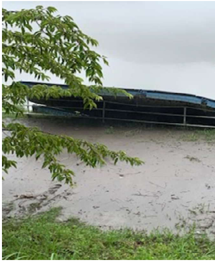
6月14日 安全柵に乗り上げた栈橋