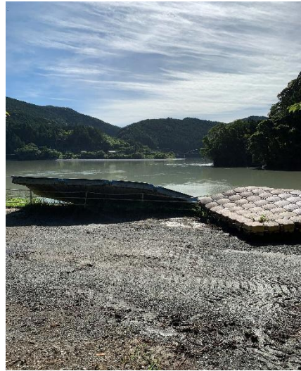
7月2日 そのままの状態