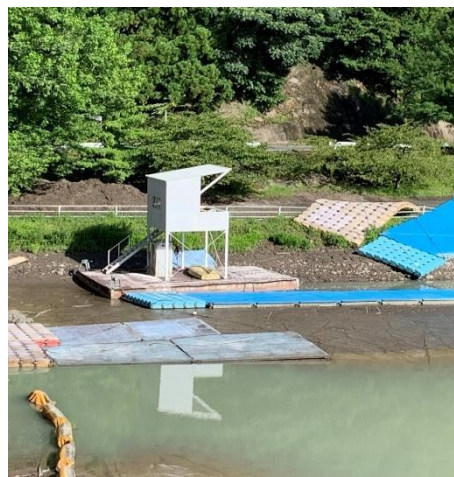
7月2日 ゴール付近状況