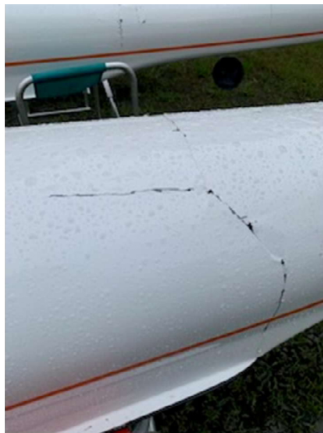
全国選抜艇 女子クォドルプル

・修理必要(全国選抜大会用11艇 修理費合計約75万円)(レンタル艇4艇 修理費合計約65万円)